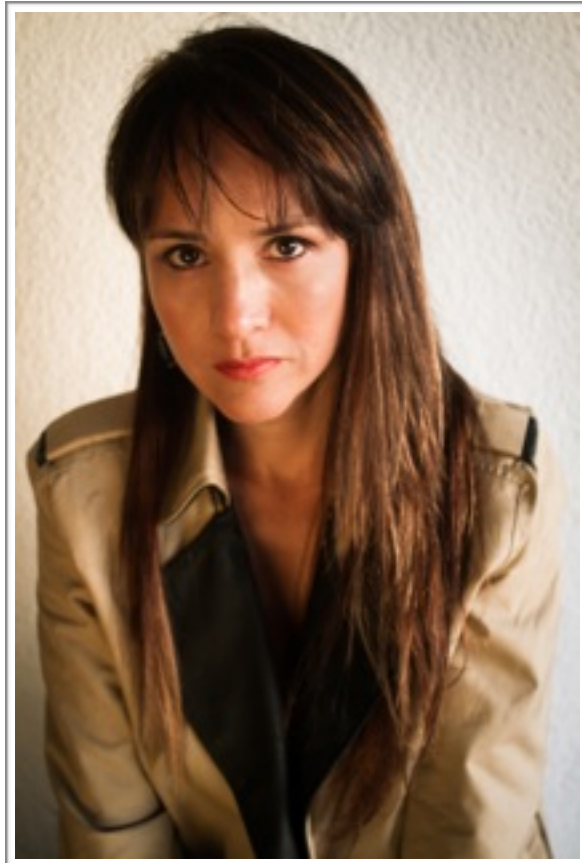
Stylism: Carina Brandan Make Up: Vanesa Miguel Joyas: Oleana Jewelry Localización: Espacio Monteviejo - Wine & Music

“...no sabemos todo, sino que se aprende a cada paso, así como una tabula rasa para evitar el prejuicio y eso es lo que más me ha ayudado en mi trabajo”